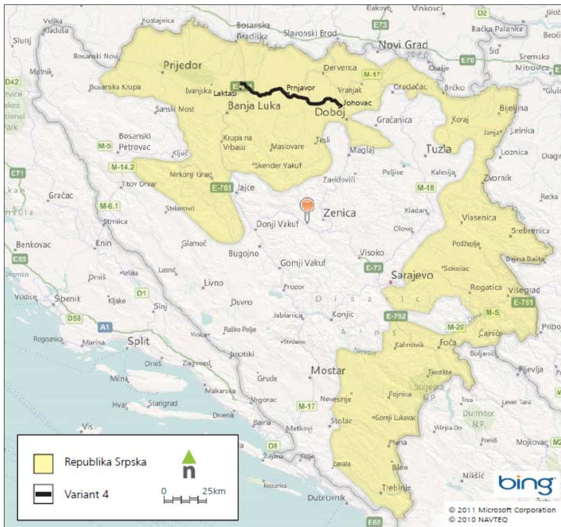
Slika 2.1: lokacija planiranog autoputa Banja Luka - Doboj