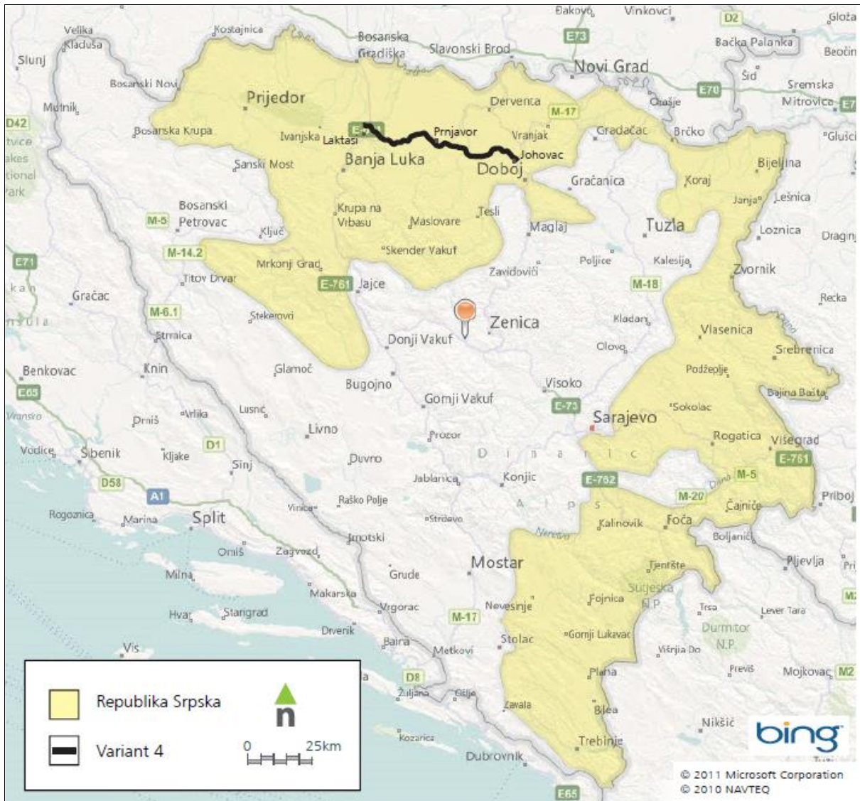
Slika 2.1: Lokacija planiranog autoputa Banja Luka - Doboј