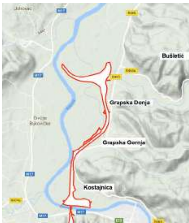
Слика 2-2 Карта насеља на подручју Пројекта 1