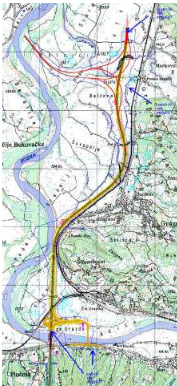
Слика 2-1 Траса Пројекта